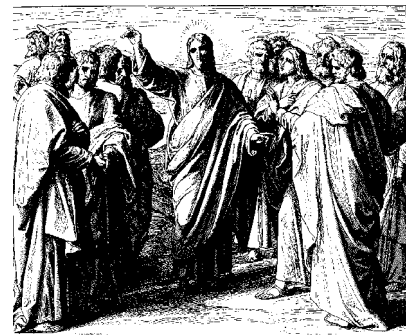
"Khi ấy, Đức Giê-su gọi Nhóm Mười Hai lại và bắt đầu sai đi từng hai người một." (Mc 6, 7).

Khi ấy, các Tông Đồ tụ họp chung quanh Đức Giê-su, và kể lại cho Người biết mọi việc các ông đã làm, và mọi điều các ông đã dạy. Người bảo các ông: "Chính anh em hãy lánh riêng ra đến một nơi thanh vắng mà nghỉ ngơi đôi chút." Quả thế, kẻ lui người tới quá đông, nên các ông cũng chẳng có thì giờ ăn uống nữa. Vậy, thầy trò xuống thuyền đi lánh riêng ra một nơi hoang vắng. Thấy các ngài ra đi, nhiều người hiểu ý, nên từ khắp các thành, họ cùng nhau theo đường bộ chạy đến nơi, trước cả các ngài. Ra khỏi thuyền, Đức Giê-su thấy một đám người rất đông thì chạnh lòng thương, vì họ như bầy chiên không người chăn dắt. Và Người bắt đầu dạy dỗ họ nhiều điều. Đó là lời Chúa.