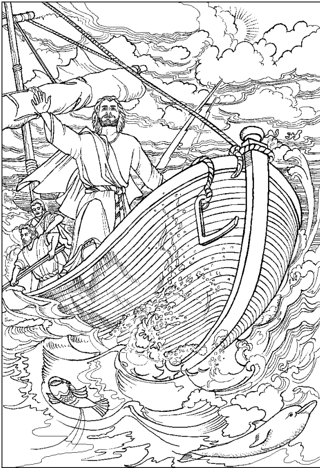
Người thức dậy, ngắm đê gió, và truyền cho biển: “Im đi! Câm đi!” Gió liền tắt, và biển lặng như tờ (Mc 4, 39).